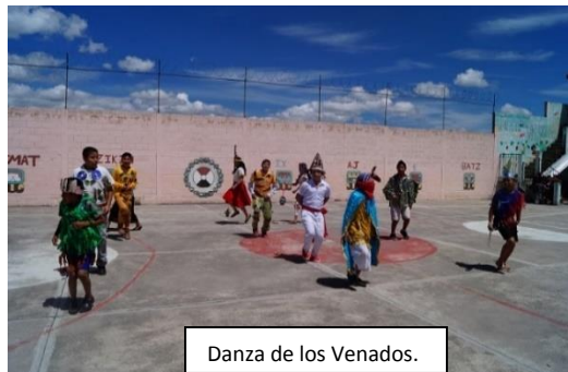
Danza de los Venados.