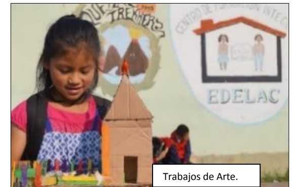
Trabajos de Arte.